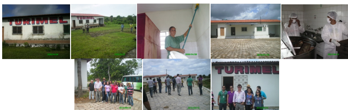
Figura 02- Evolução da estrutura da associação TURIMEL com os parceiros: SENAR, SEBRAE, BANCO DO BRASIL, CÁRITAS do Brasil e a MANITESE, italiana, e como contra partida mão de obra dos apicultores.

Os impactos apontados pelos apicultores da comunidade de Santa Luzia do Paruá indicam a melhoria da renda familiar e a geração de renda no município como a maior contribuição da apicultura para a comunidade.