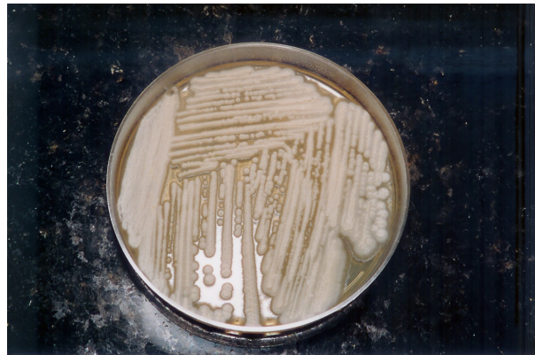
Figura 3 – Aspecto da colônia leveduriforme de Trichosporon spp em Sabouraud Dextrose Agar.

O material pode ser semeado em ágar Sabouraud dextrose (cicloheximida é inibitório), e incubado entre 25 e 30° C. As colônias crescem rápido apresentando-se cremosas, leveduriformes, branco-amareladas, com superfície lisa, tornando-se rugosas e cerebriformes mais tarde (MEZZARI, 2001).